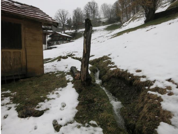
Foto 5: Ufererosion im Bereich Bienenhaus (Blick gegen Fließrichtung).