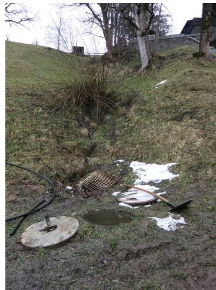
Foto 12: Ehemaliger Bachlauf und Schacht auf Parzelle 3199 bzw. bei Undrem Stein. Blick gegen Fließrichtung.