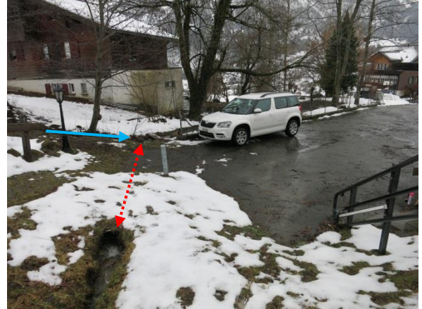
Foto 6: Durchlass bei Zugang zu Eschengasse 28 + 30 (roter Pfeil). Zufluss eines Seitengewässers unterhalb des Durchlasses (blauer Pfeil). Blick in Fließrichtung.