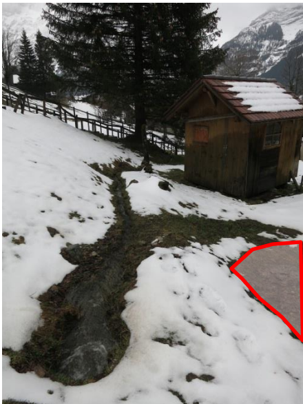
Foto 3: Ausdolung auf Kote 1'095 m ü. M., rechtsufrigen Vernässungen (rotes Polygon) sowie Bienenhaus (Blick in Fließrichtung).