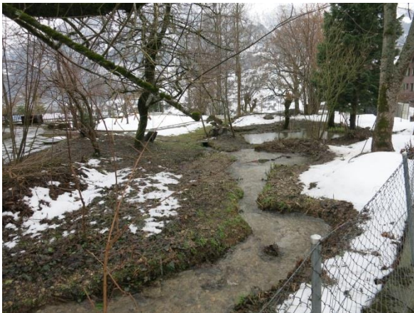
Foto 7: Aellmattengräbli und Biotop auf der Parz. 2329 (Blick in Fließrichtung).