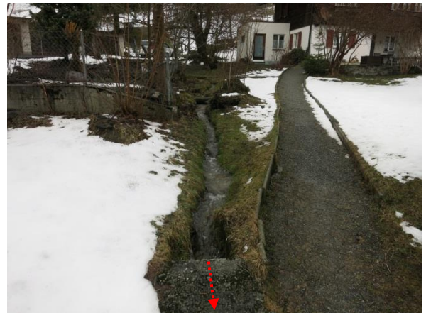
Foto 8: Aellmattengräbli auf Parz. 2329 oberhalb des Durchlasses Mittelmattenweg (roter Pfeil). Blick gegen Fließrichtung.