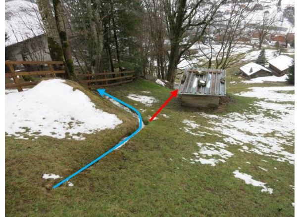
Foto 10: Ausdolung unterhalb Eschengasse und Linienführung zu Liegenschaft Eschengasse 19 (blauer Pfeil) und geplante Linienführung (roter Pfeil). Blick in Fließrichtung).