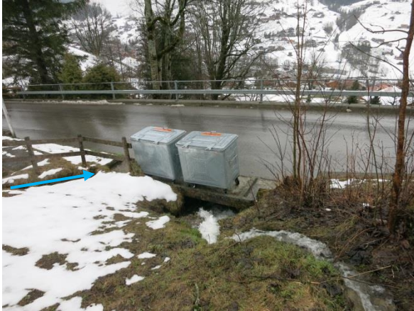
Foto 9: Durchlass Eschengasse mit Containerstandort und kleinem Entwässerungsgraben (blauer Pfeil). Blick in Fließrichtung).