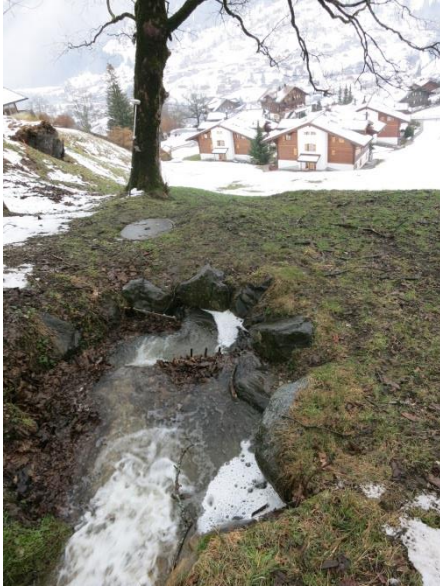
Foto 1: Kiesfang und Eindolung auf Kote 1'120 m ü. M. (Blick in Fließrichtung).