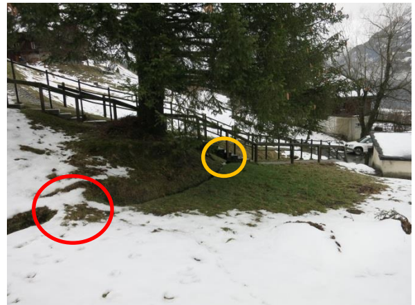
Foto 4: Aufzuhebender Durchlass (roter Kreis) sowie Durchlass bei Treppenzugang zu Liegenschaften Eschengasse 28 und 30 (oranger Kreis). Blick in Fließrichtung.