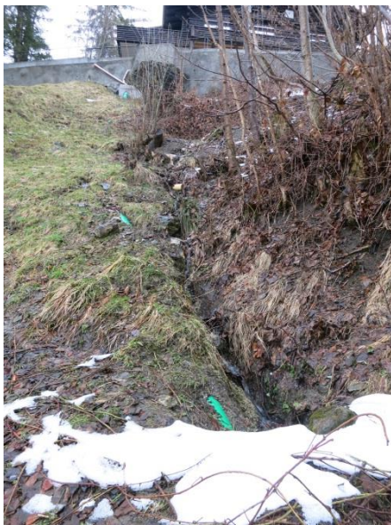
Foto 11: Eingedoltes Aellmattengräbli unterhalb Eschengasse 19 (grünes Rohr) sowie oberflächlich abfließendes Meteor- und Drainagewasser (Blick gegen Fließrichtung).